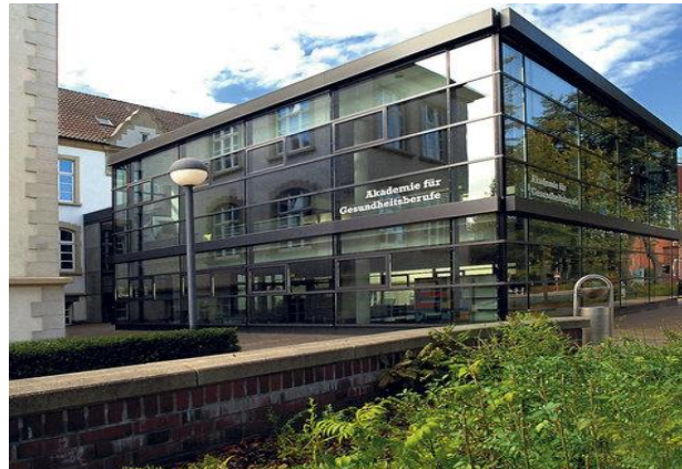
Akademie für Gesundheitsberufe, Rheine